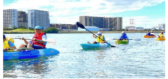
10月23日カヌー訓練 多摩川